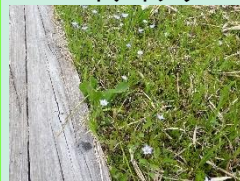
タテヤマリンドウ