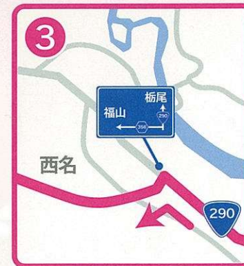
「福山」の看板を目印に県道356号へ左折。約10分道なりに進む。