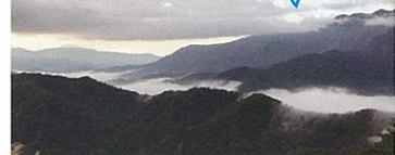
駐車場より徒歩:約3分