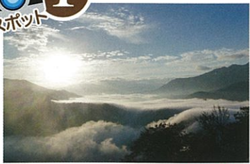
駐車場より徒歩:約5分