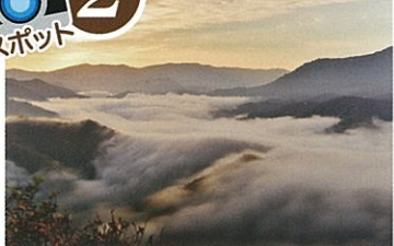
駐車場より徒歩:約15分