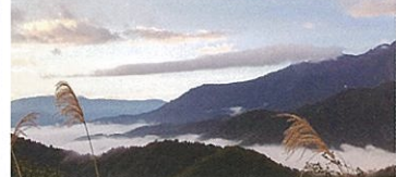
駐車場より徒歩:約6分