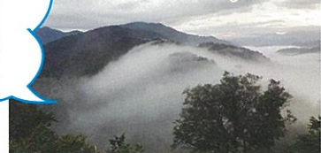
駐車場より車:約5分