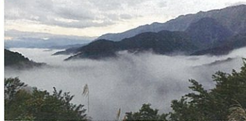
駐車場より車:約6分