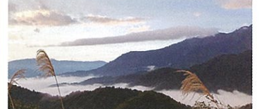
駐車場より徒歩:約6分