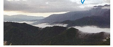
駐車場より徒歩:約3分