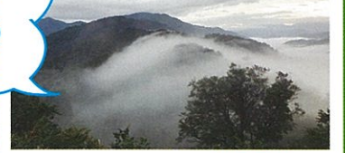
駐車場より車:約5分