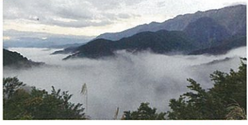
駐車場より車:約6分