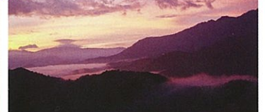
駐車場より徒歩:約15分