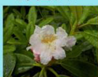
ハクサンシャクナゲ

釜ヶ堀湿原ではコバイケイソウの大群落が見られます。 尾瀬沼南岸は通行に注意が必要な場所があります。山道に慣れていない方や、雨天時は、足元にとくに気をつけてご通行ください。