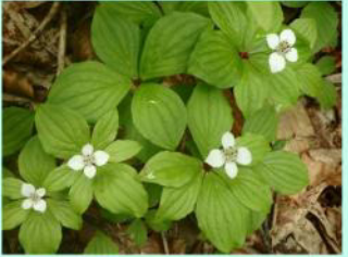
ゴゼンタチバナ。葉を6枚付けるまで成長しないと花を咲かせません。