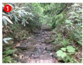
1 白砂峠の最後の登り。岩がゴロゴロしています。雨の日は増水しやすく、滑りやすいです。