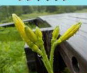
ニッコウキスゲの蕾