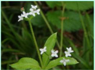
オククルマムグラ。小さく可憐な白い花を付けます。輪生の葉も可愛らしいです。