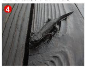
4 雨の日は木道にアカハライモリが出てくる場合があります。