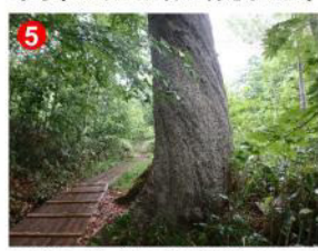
5 見晴に近づくると幹が捻れたミズナラの木が見られます。