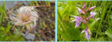
チングルマの果穂