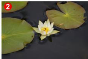
2 ヒツジグサの白い花が池塘の中で咲いています。