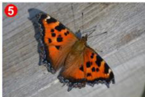
5 ベンチで休憩しているとヒオドシチョウが飛んできました。