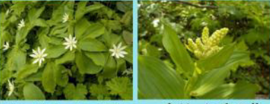
キヌガサソウの群落