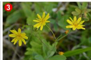
3 木道のすぐ近くでキク科のハナニガナを見つけました。