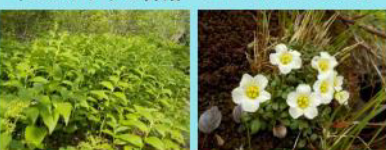
ヒロハユキザサの群落