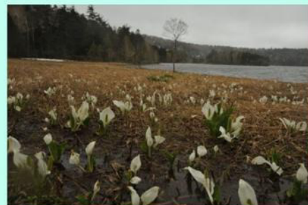
ミズバショウと尾瀬沼