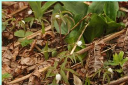
ヒメイチゲ(小淵沢田代分岐付近)